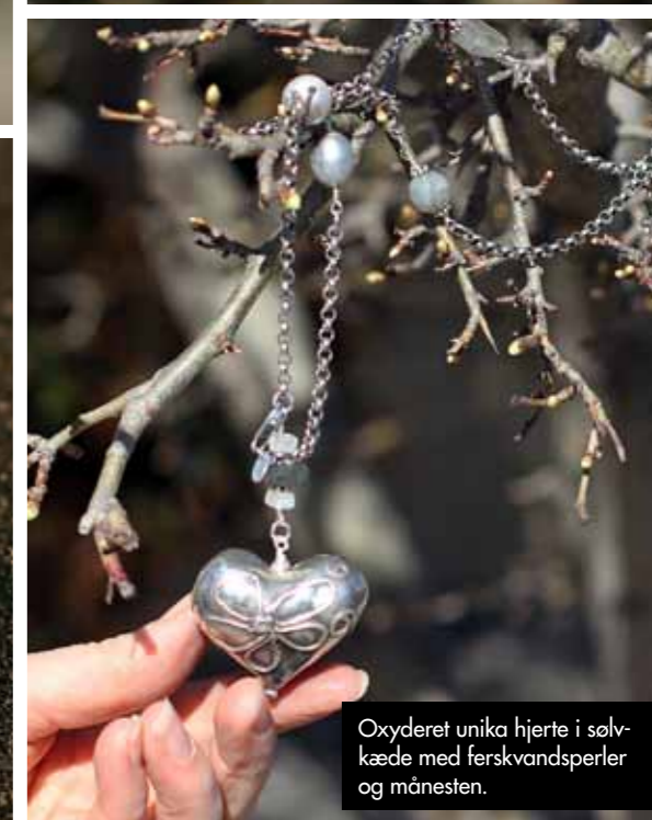
Oxyderet unika hjerte i sølvkæde med ferskvandspærler og månesten.