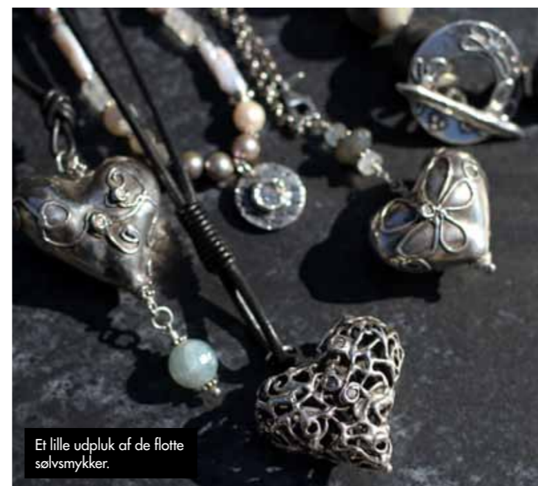
Et lille udpluk af de flotte sølvsmykker.

Dot Keramik Skagensvej 270/Nielstrup/9970 Strandby Tlf.: 98 48 14 10/www.dot-keramik.dk