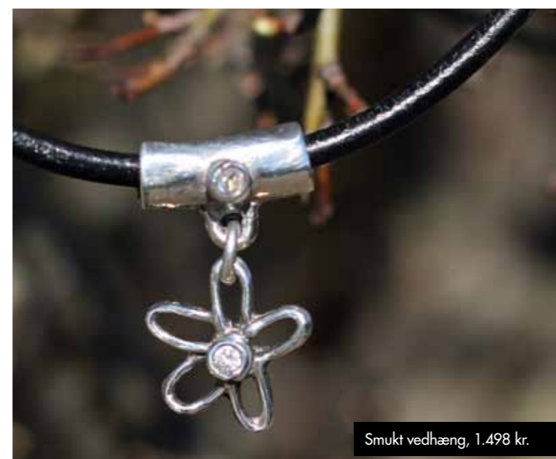
Smukt vedhæng, 1.498 kr.